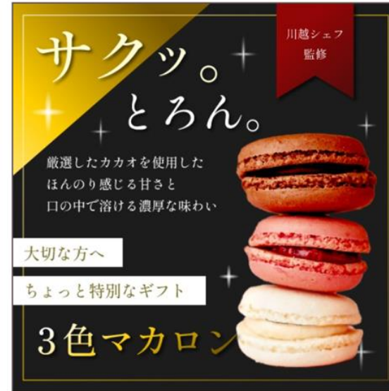
【架空】限定マカロンver.2