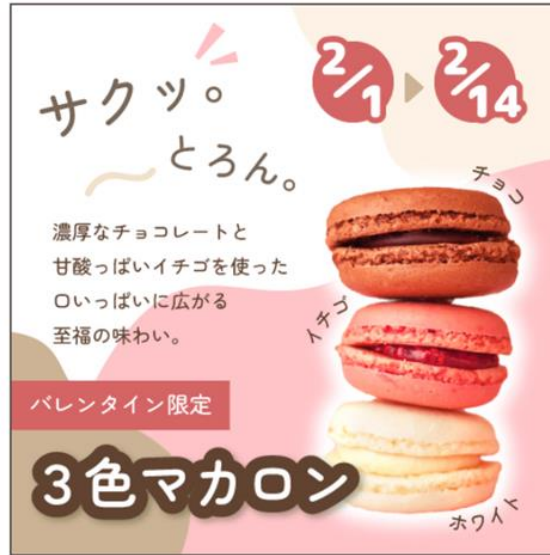
【架空】限定マカロンver.1